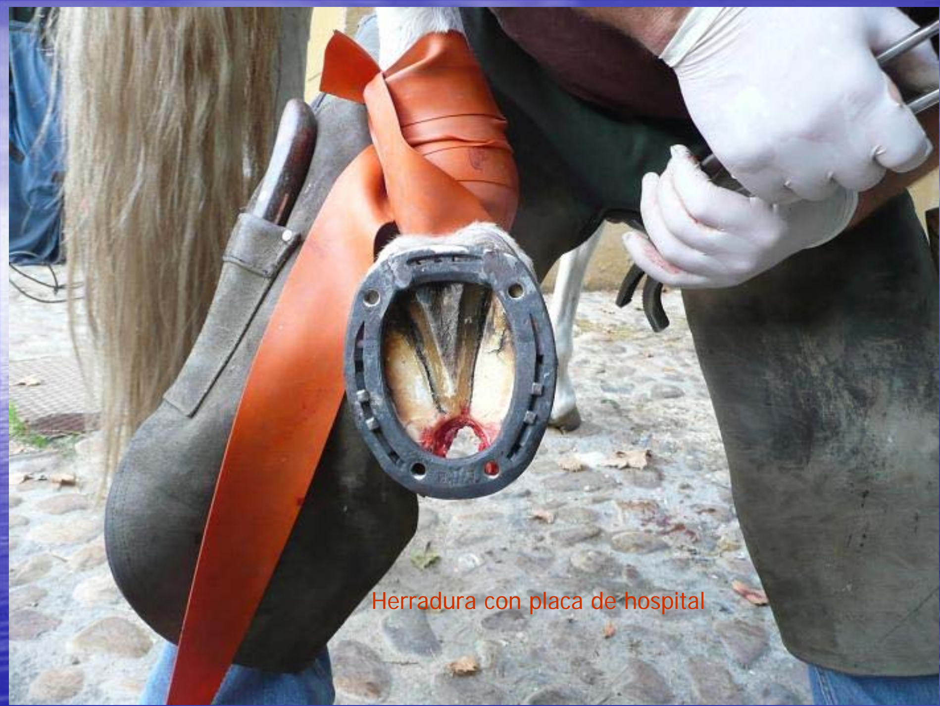
Herradura con placa de hospital